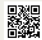
丹波焼の情報は こちらから