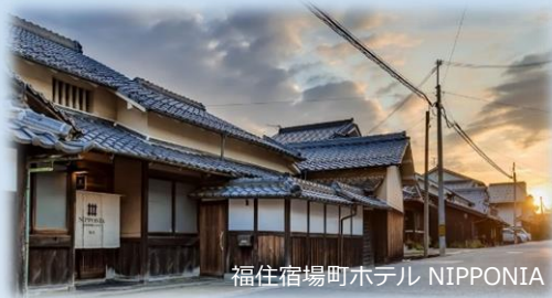
福住宿場町ホテル NIPPONIA

タクシーの定額乗り放題サービスをご利用いただき、 篠山エリアの豊富な観光コンテンツをお楽しみください♪